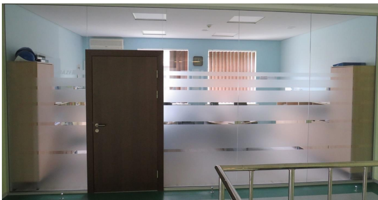
Izbūvējamās pilnstikla sienas piemērs